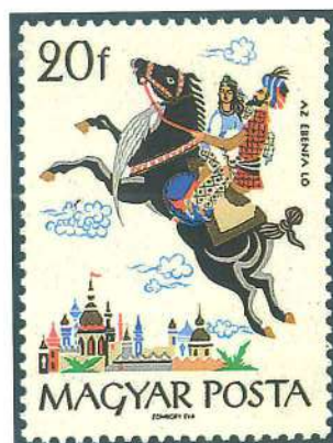
Los personajes de los cuentos populares también han ilustrado numerosas series. Aquí, sello holandés de 1964 dedicado a la Caperucita roja y emisión húngara de 1965 dedicada a las Mil y una noches.

del Antifaz. Otros países siguen la misma línea editorial con sus propios personajes o con los conocidos mundialmente. Los productos Disney son reproducidos periódicamente por Mongolia, Bután, Lesotho o los países del Caribe. Su gran aceptación los hacen comercialmente interesantes y cada año se venden millones de sellos de este tipo. Los dibujos animados de la televisión también han sido llevados a los sellos. Mongolia, uno de los países que mejores series ha dedicado a la infancia, en 1991 destinó una a la familia Picapiedra.