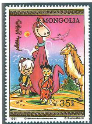
Los Picapiedra visitan Mongolia en esta serie emitida en 1991 por la administración postal de este país.