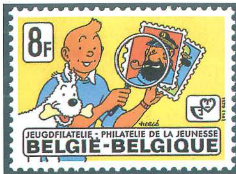
El intrépido Tintín también es un aficionado a los sellos (sello belga de 1979 diseñado por su creador, el gran Hergé).

En la actualidad, ya no sólo se dedican a los menores series de beneficencia o con mensajes sociales, sino también numerosos ejemplares ilustrados con los grandes personajes de los cómics. Estas últimas series también constituyen una temática especializada que hoy en día está experimentando un gran auge. En las últimas décadas se ha asistido a un cambio en la política de las