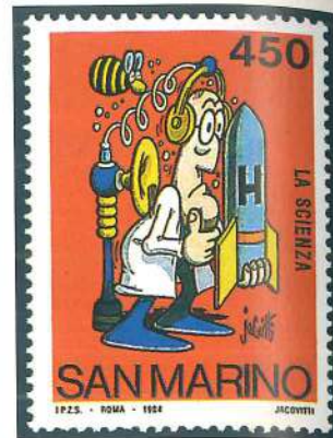
Dibujos de Jacovitti ilustran la serie de San Marino de 1984 dedicada a la escuela y la filatelia.

Francia, al igual que Bélgica, dedica gran atención a los jóvenes filatélicos, por lo que periódicamente realiza una exposición filatélica itinerante para ellos, que es apoyada con una emisión especial de diseño infantil. San Marino, país pionero en las emisiones de dibujos (ya en 1970 dedicó a Walt Disney diez valores), en 1984 emitió una serie infantil dedicada a la escuela y filatelia, con seis temas didácticos sumamente ingeniosos.