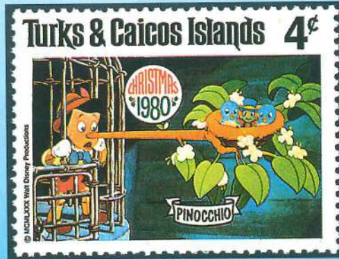
Numerosos países han rendido homenaje a Pinocho, personaje creado por Carlo Lorenzini Collodi. Junto a estas líneas, sellos de Italia (1954), Turks & Caicos (1980) y San Marino (1990).

Las aventuras de Pinocho, personaje creado por el escritor y periodista Carlo Lorenzini Collodi (Florencia 1826-1890), son mundialmente conocidas. Italia ya emitió un sello en su honor en 1954 reproduciendo a su inmortal personaje. Otros países